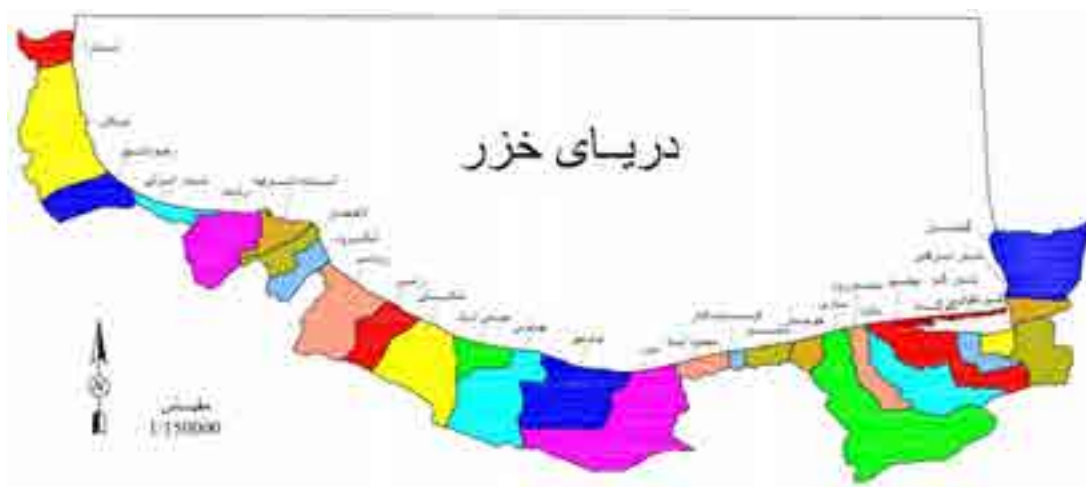
نگاره ۱: موقعیت محدوده مورد مطالعه

که آسایش در انسان مشتق از معادله تراز گرمایی بدن انسان و محیط وی می‌باشد. ساری صراف و همکاران (۱۳۸۹) در مقاله‌ای به پهنه‌بندی کلیماتوریسم منطقه ارسباران با استفاده از شاخص TCI پرداختند و به این نتیجه رسیدند که ماه‌های خرداد، تیر، مرداد و شهریور با نمره TCI (۹۰-۱۰۰) بهترین شرایط را از نظر اقلیم آسایش داشته و ماه‌های آذر، دی و بهمن در تمامی ایستگاه‌های مورد مطالعه فاقد آسایش اقلیمی می‌باشد.